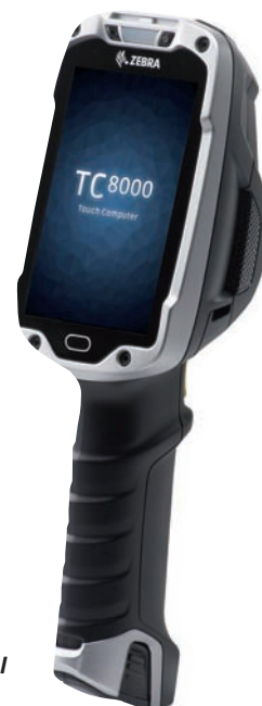
Le terminal TC8000

La montée en puissance de l'OS Android et son adéquation avec les attendus des utilisateurs professionnels ont incité de nombreux constructeurs à investir ce marché porteur. Mais seul Zebra Technologies se détache du peloton : le constructeur capte actuellement 64% des terminaux professionnels fonctionnant sous Android, loin, très loin devant les 8% commercialisés par le numéro 2 du marché, et propose des versions Android récentes. Plusieurs terminaux Zebra sont d'ailleurs déjà référencés via la plateforme « Google Enterprise Recommended », régulièrement complétés par de nouveaux modèles. Une prédominance à mettre notamment en regard avec deux facteurs. D'abord, une fiabilité et une robustesse remarquables, grâce à l'architecture tout-