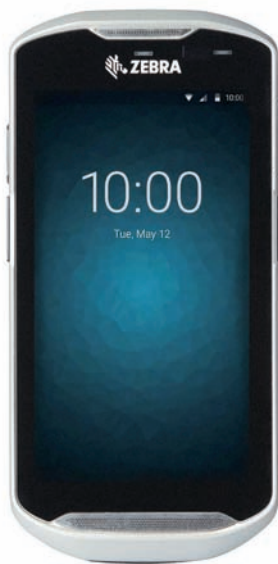
Le terminal TC56

de gestion avancées, y compris en ce qui concerne l'alimentation des terminaux. D'un point de vue sécuritaire, l'adoption généralisée d'Android impactera profondément les pratiques de gestion traditionnelles, et requerra l'accès à de nouvelles compétences ou leur acquisition, pour assurer le déploiement et la gestion du parc de PDA et de terminaux métier.